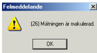
Bild 9. En meddelanderuta bekräftar att du öppnar en tidigare generation.

Det går att öppna en tidigare generation för att se vilka ändringar som har gjorts. Ange vilken generation du vill se i fältet generation och tryck på knappen öppna i verktygsfältet. Då öppnas vald generation. Väljer du att ha fältet blankt och trycker på knappen öppna , visas den senaste generationen.