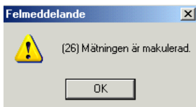
Bild 4. En meddelanderuta berättar att mätningen är makulerad.

Tryck på knappen ok så öppnas mätningen. Meddelanderutan visas för att förtydliga att den mätning du vill öppna inte längre är gällande.